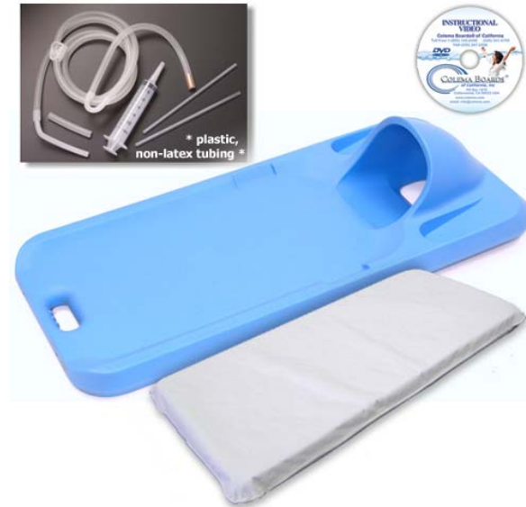
Tabla de contenidos